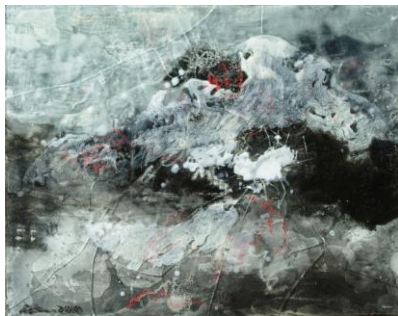
Bird's eye view series # 1, 16" X 20", Acrylic, pouring medium and glass on canvas on board, Gary Hong