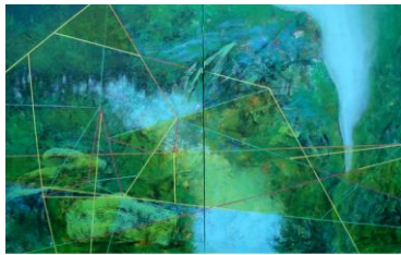
LANDSCAPE, 30" X 44", 2008 MIXED MEDIA, GARY HONG